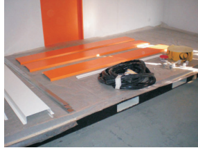
Montagematerial im Container zur Expedition vorbereitet