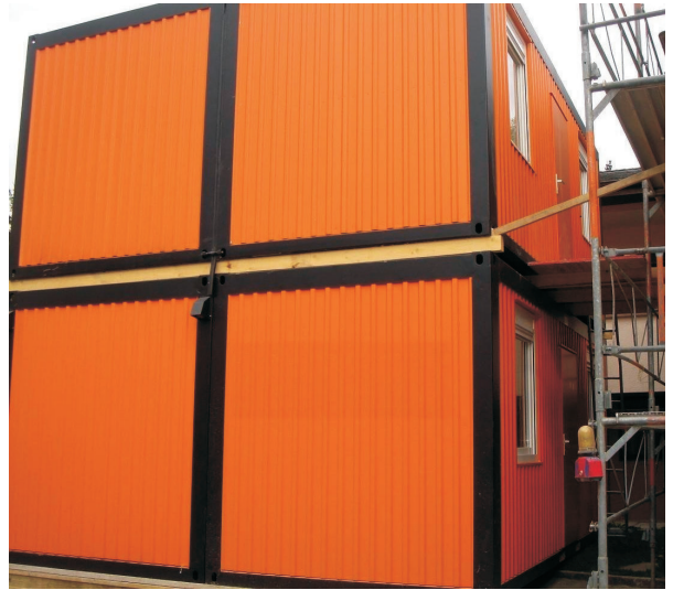
fertige Anlage: 1x Duoanlage oben, 2x Einzelcontainer unten